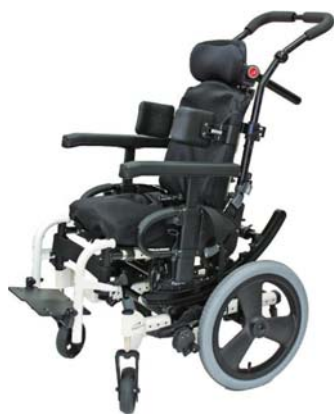
3歳から成人になるまで1台で 対応可能なジッピーシリーズ