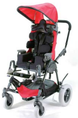
乳幼児から小学校入学まで 使用可能なキッドカート