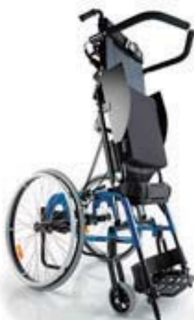
スタンディング車いす