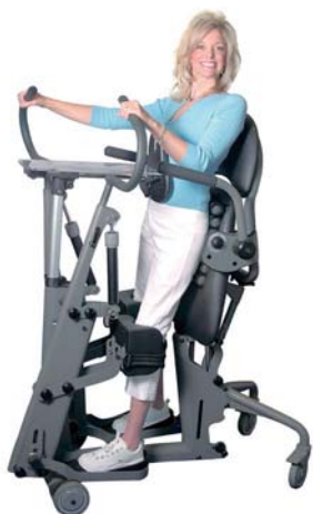
スタンディングフレーム