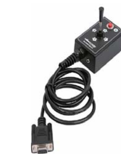
VR-2 または R-NET + 4ウェイトグルスイッチ