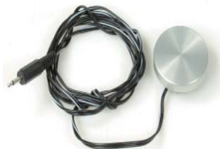
ディスクスイッチ