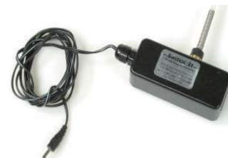
ウォブルスイッチ