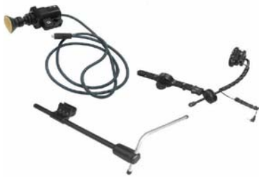
プロポーションナル・ チン・コントロール