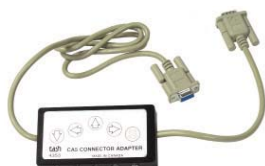
CA5 スイッチアダプター