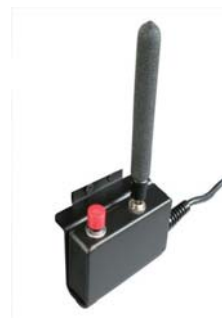
VR-2 + デュアルトグル

ジョイスティックとトグルスイッチを組み合わせると、電動ポジショニングの操作をトグルスイッチで行えます。