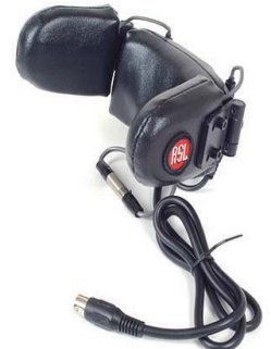
ASL センター式 ヘッドコントロール (小型)