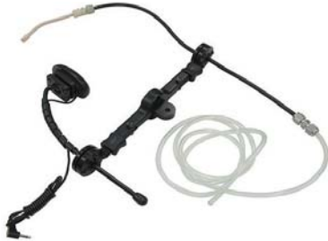
シップ&バフ (呼気吸気スイッチ)

特殊コントロールは、ジョイスティックの使用が困難な方の、車いすの操作や電動ポジショニングの操作などを可能にします。