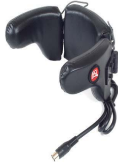
ASL センター式 ヘッドコントロール (成人用)