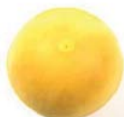
フォームボールハンドル