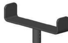
ゴールポストハンドル