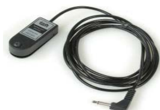
マイクロライトスイッチ