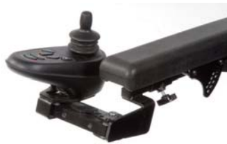
スイングアウト式マウント

ジョイスティックハンドルは、ご使用になる方のニーズに合わせて、持ちやすい形状を選択することでジョイスティックの操作がスムーズになります。