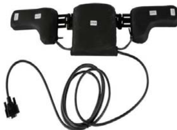
Switch It センサー式 ヘッドコントロール (成人用)