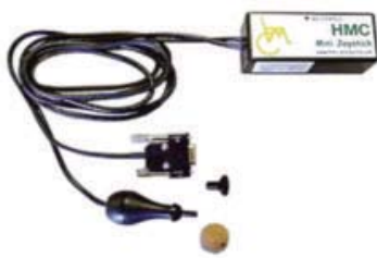
ASL プロポーションナル・ ミニジョイスティック チン/リップ・ コントロールパッケージ