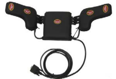
Switch It センサー式 ヘッドコントロール (小型)