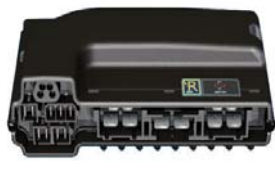
R-NET 拡張型コントロール