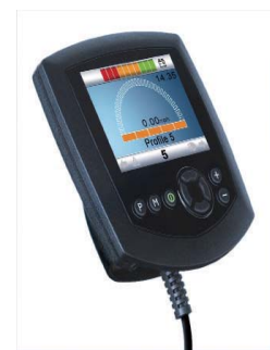
OMNI + スイッチ類

OMNIモジュールと次ページのスイッチ類を組み合わせることで、スイッチによる車いすの操作や電動ポジショニングの操作が行えます。