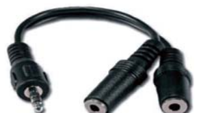
ステレオ 2モノ スプリッター