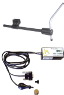
ASL プロポーションナル・ ミニジョイスティック ミッドライン・スイングアウト (Gatlin パッケージ付き)