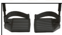
コンポジット フットプレート