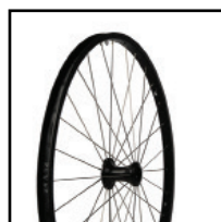
ライトウエイトホイール