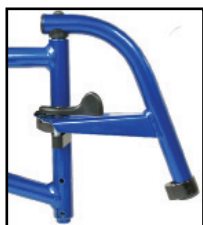
70°スイングイン /アウトハンガー