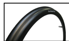
ナチュラルフィット ハンドリム