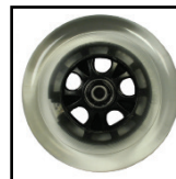
ライトアップキャスト ホイール