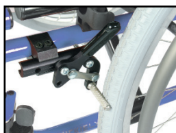
ハイパフォーマンスブレーキ