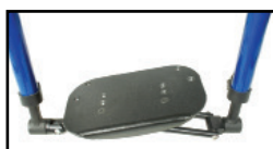
オートフォルディング フットプレート

参考オプションは代表的なオプションパーツの抜粋です。詳細はオーダーフォームをご覧ください。販売店までお問い合わせください。