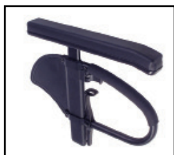
高さ調整アームレスト