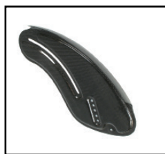
カーボン製サイドガード