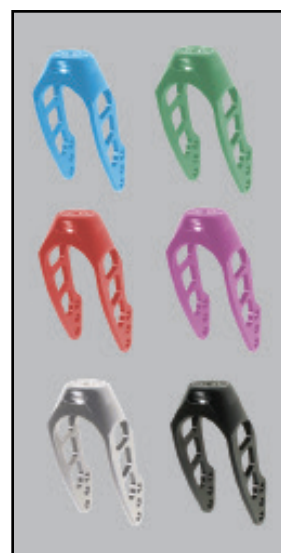
アノダイズド キャストフォーク