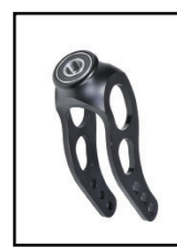
マルチポジショニング フォーク