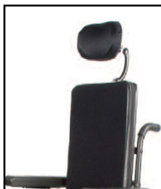
ソリッドバックレスト