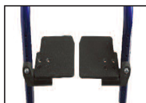
角度調整式フットレスト （小型）