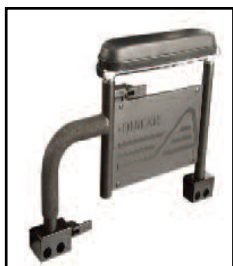
高さ調整式デュアルポスト アームレスト