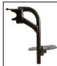
90° スイングアウト式 レッグサポート