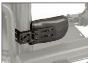
ラテラルサポート