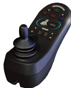
R-Net ジョイスティック