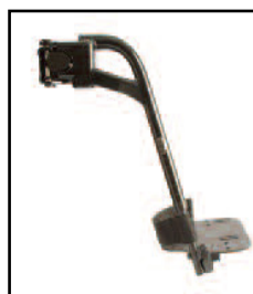
70° スイングアウト式 レッグサポート